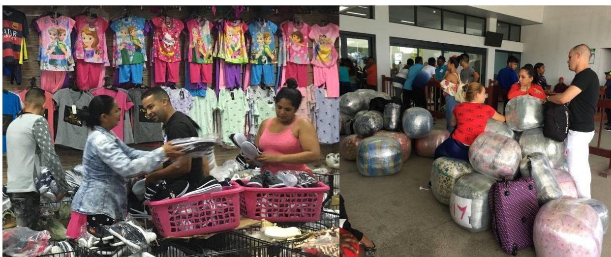
Fotos: cubanos realizando compras en un mercado de Guyana, luego el chequeo en el aeropuerto de Georgetown.

Los viajes de cubanos a destinos populares para compras como Cancún se han multiplicado desde que en el 2013 el gobierno cubano eliminó el permiso de salida, una traba que durante décadas impidió que los cubanos viajaran libremente. Ernesto Soberón, director de Asuntos Consulares de la cancillería cubana, informó que entre 2013 y 2016 más de 670 mil cubanos viajaron al exterior y el 78% lo hizo por primera vez. Agregó que de esa cifra “solo un 9 por ciento emigró, o sea, no regresó al país dentro del periodo de los 24 meses establecidos en la nueva Ley Migratoria vigente desde el 14 de enero de 2013”. 3