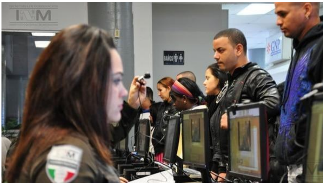
Foto. Los cubanos varados en Tamaulipas, cuando acuden a El Instituto Federal de Defensoría Pública de México para recibir visas especiales con el fin de poder radicarse y trabajar en México.

consigo una crisis migratoria que puso al Estado Mexicano en una situación embarazosa (Gámez, 2017) 6 .