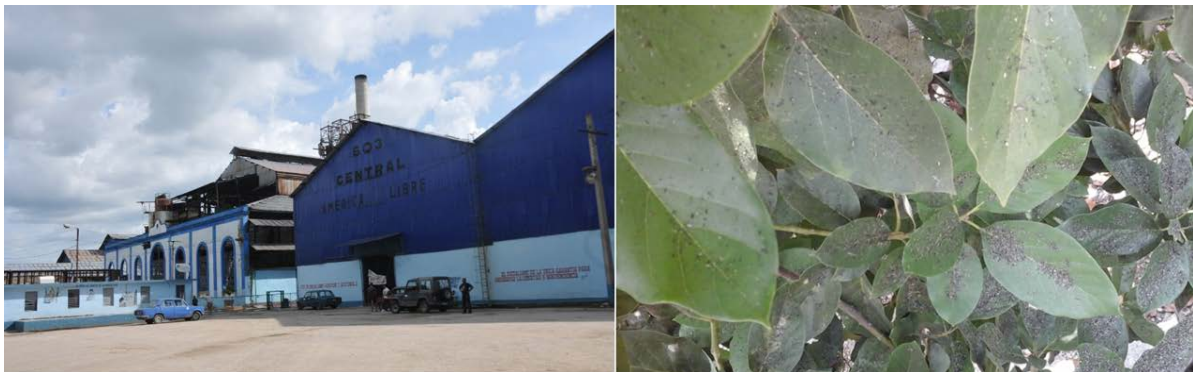
Figura 3. Contaminación ambiental generada por el central azucarero “América Libre”. De izquierda a derecha: 1) el central azucarero; 2) una planta de aguacate cubierta de bagacillo en una vivienda del barrio “Nito Ortega”, a una distancia de 2 km del central (16 de abril de 2018).